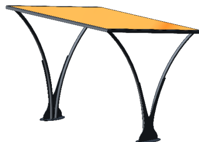
Option toile type Ferrari