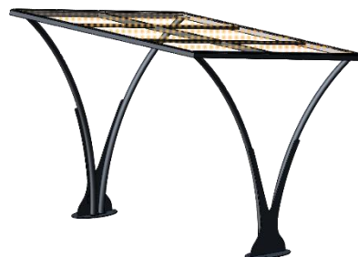
Avec toit polycarbonate transparent