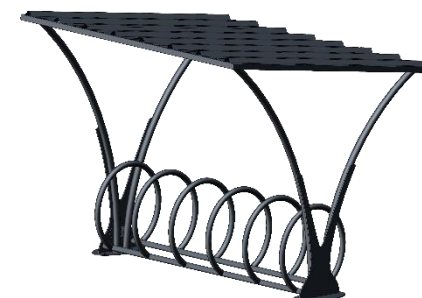
Option appui-vélos AVA 20